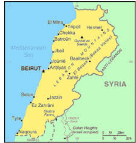
campo profughi di Bebnine