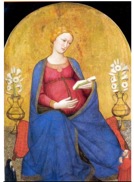
Madonna del parto, Pieve di Montefiesole (Fi), XIV sec. di Antonio Veneziano

Forse un'osservazione che troverete banale, ma a me colpisce: nella lingua italiana Dio e donna, iniziano entrambe con la lettera D .