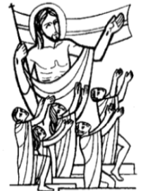
COMMEMORAZIONE DI TUTTI I FEDELI DEFUNTI

- Ore 20,00: Servizio di volontariato al dormitorio "Pallavicini" - gruppo adulti papà e mamme.