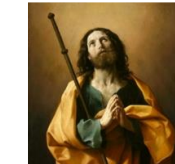
S. Giacomo della Croce del Biacco