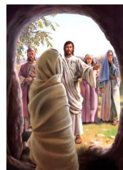
La Resurrezione di Lazzaro: Gv 11, 1-45