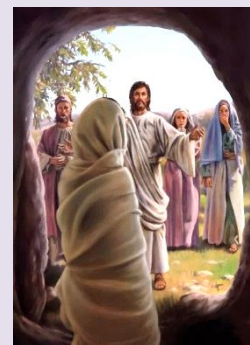
La Resurrezione di Lazzaro: Gv 11, 1-45