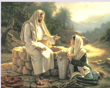
La Samaritana: Gv 4, 5-42

I Vangeli dell'Anno A delle domeniche di Quaresima (15-22-29 marzo) sono i grandi Vangeli usati dalla Chiesa fin dai primi secoli per catechizzare e preparare così i Catecumeni al Battesimo per la Notte di Resurrezione della Pasqua del Signore Gesù