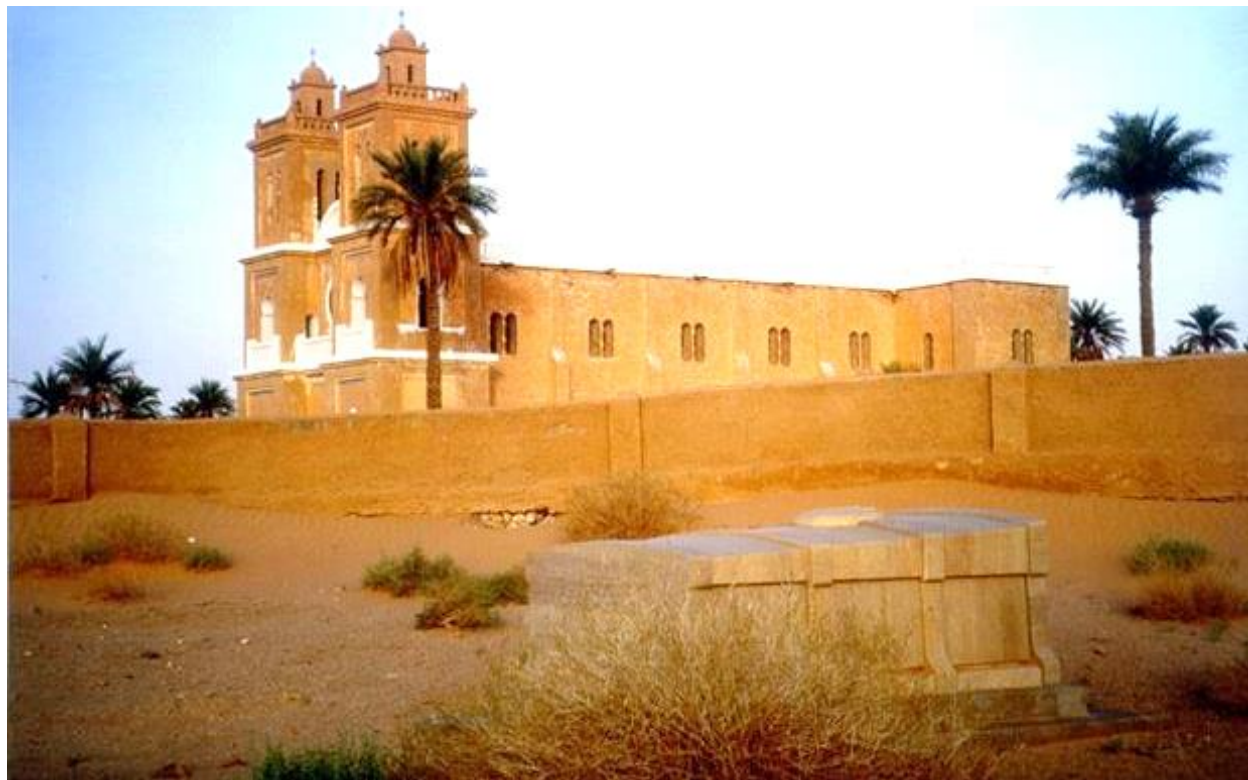
La tomba di Charles de Foucauld a El Meniaa, in Algeria

sacramento degli uomini, dei poveri. Qui non si tratta di una visione ideologica o filantropica, ma dell'amore per Gesù, che ci porta a camminare con tutti. Del resto segni dello spirito, segni del Vangelo sono presenti in ogni uomo, in coloro che sanno prendere atto della propria coscienza, oppure che sanno vivere la fede come luogo in cui si esprime il regno. Ci sono state guerre di religione no? Ebbene san Francesco è stato l'uomo che ha messo, direbbe papa Giovanni, gli occhi negli occhi del sultano, il cuore nel suo cuore tanto che senza conoscere le rispettive lingue si sono parlati. Questa è la fraternità.