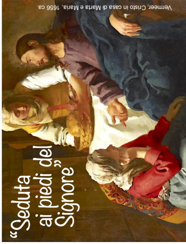
Vermeer, Cristo seduto ai piedi della Vergine e della Santa Marta, 1656 ca.

PROPOSTA DI 2 GIORNI DI RITIRO ED IPREGHIERA