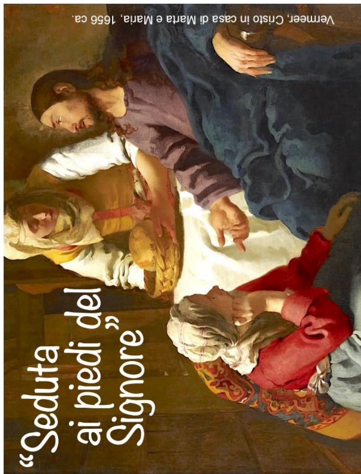
Vermeer, Cristo in casa di Marta e Maria, 1656 ca.

PROPOSTA DI 2 GIORNI DIRITIRO E DI PREGHIERA