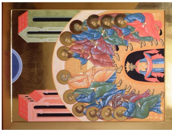
Gianluca Busi, Pentecoste