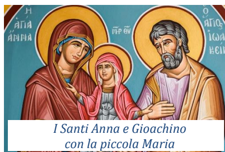
I Santi Anna e Gioachino con la piccola Maria

dalle 9.30 alle 15.00 CONVEGNO DEI MINISTRANTI presso il Seminario Arcivescovile di Bologna - p.le Bacchelli 4 - ore 18.30 S. Messa prefestiva