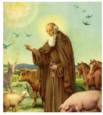
S. Antonio di Savena