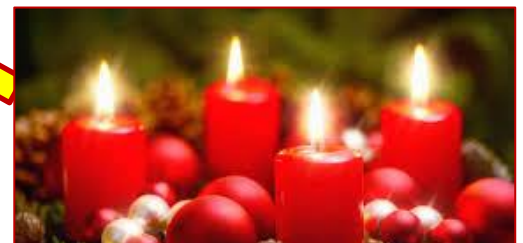
La quarta candela è detta "degli Angeli", i primi ad annunciare al mondo la nascita del Messia.