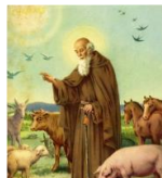
S. Antonio di Savena