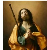
S. Giacomo della Croce del Biacco