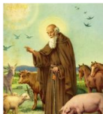
S. Antonio di Savena